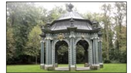
Csillag alakú nyiladékok, úgynevezett vadászcillag középpontjában áll a vadászpavilon, Mária Terézia császárnő kedvenc kártyázó helye

Laxenburg hagyományai, történelmi jelentősége nemcsak a kas-