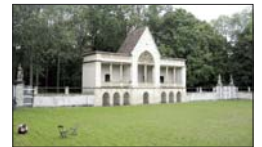
A német lovagkort idéző tribün a lovagi tornapálya mellett

télyparkban érhetőek tetten, hanem a település egyéb pontjain is. A plébániatemplom a korai osztrák barokk építőművészet legjelentősebb remekműve, mai formáját a török háború után, 1683-ban kapta. A Kaiserbahnhof (Császári pályaudvar) 1850-ben épült, és Európában az egyetlen megmaradt biedermeier pályaudvar, nemrégiben kommunikációs- és rendezvényközpont céljára újították fel. Európa legmodernebb filmarchívuma szintén Laxenburgban kapott otthont, több mint 120 ezer tekerccsel ez Ausztria legnagyobb filmgyűjteménye. A kastély és a kastélyszínház termei ma elegáns konferenciaközpontként működnek: üléseknek, banketteknek és koncerteknek adnak helyet. Minden év júniusának első vasárnapján a Doblhoff-parkban rendezik a színpompás Rózsafesztivált, ahol ilyenkor minden a rózsáról szól. A Rosarium területén több mint 600 különböző rózsafajta nyílik ilyenkor.